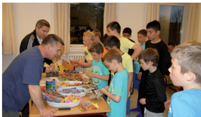
Den populære slikbod.