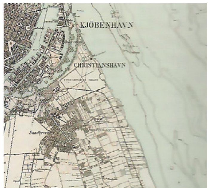
Nordamager og Amagerbanen 1907.

Københavns rettergang (henrettelsesplads) er i årene 1806-1857 placeret på Christianshavns Fælled i nærheden af det nuværende Øresunds kollegie.