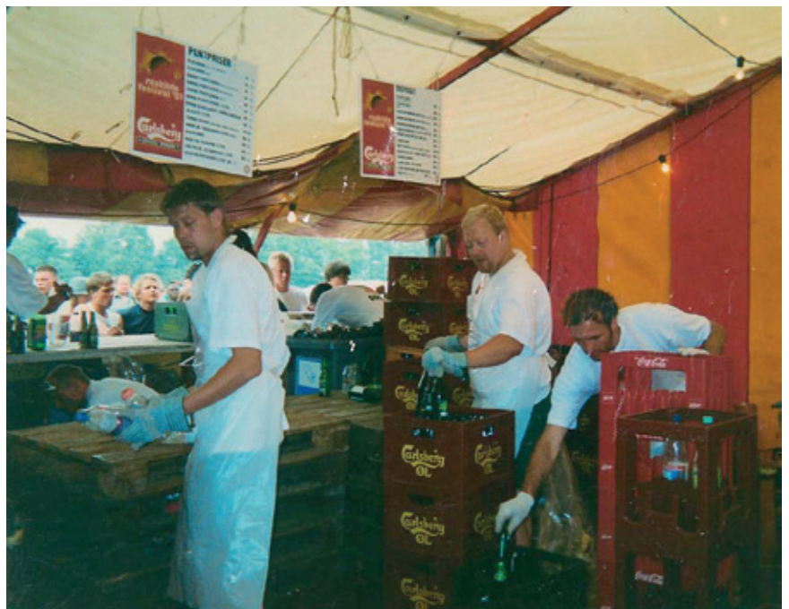
Aktive medlemmer servicerer festivalgæsterne.