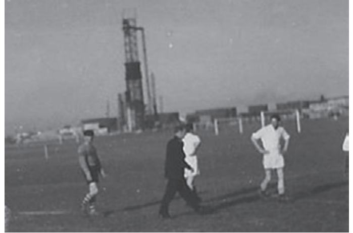
Pyrolyse-tårnet set fra spillersiden.

vermarkens græsareal er hermed reduceret til den nuværende udformning. Pyrolyseværket omdanner råolie til industriel alkohol og bygas. Forsyning sker via olie fra havnen og oplagringsøen, Prøvestenen, som da var Danmarks største oliehavn. Værkets 100 m høje produktionstårn var et var-tegn for hele bydelen og fra toppen brændte en stor flamme (spildgas). Den lette gas blev via KBH belysningsvæsen ført ud til københavnske husstande (nok til 1/3 del af byens modtagere). Alkoholen blev ledt til De Danske Spritfabrikker, som blev nabo til værket. Også spritfabrikken var meget karakteristisk med kilometervis af rør for produktion af syntesesprit til snaps og gl. Dansk. Mærsk Raffinaderiet producerede senere også Danmarks første plasticgranulat. I 1978 lukkede pyrolysedelen og den evigt brændende flamme gik ud. Værket er fjernet, men i spritfabrikkens lokaler har tøjgiganten IC Company til huse.