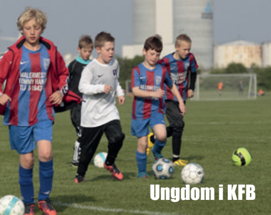
Ungdom i KFB