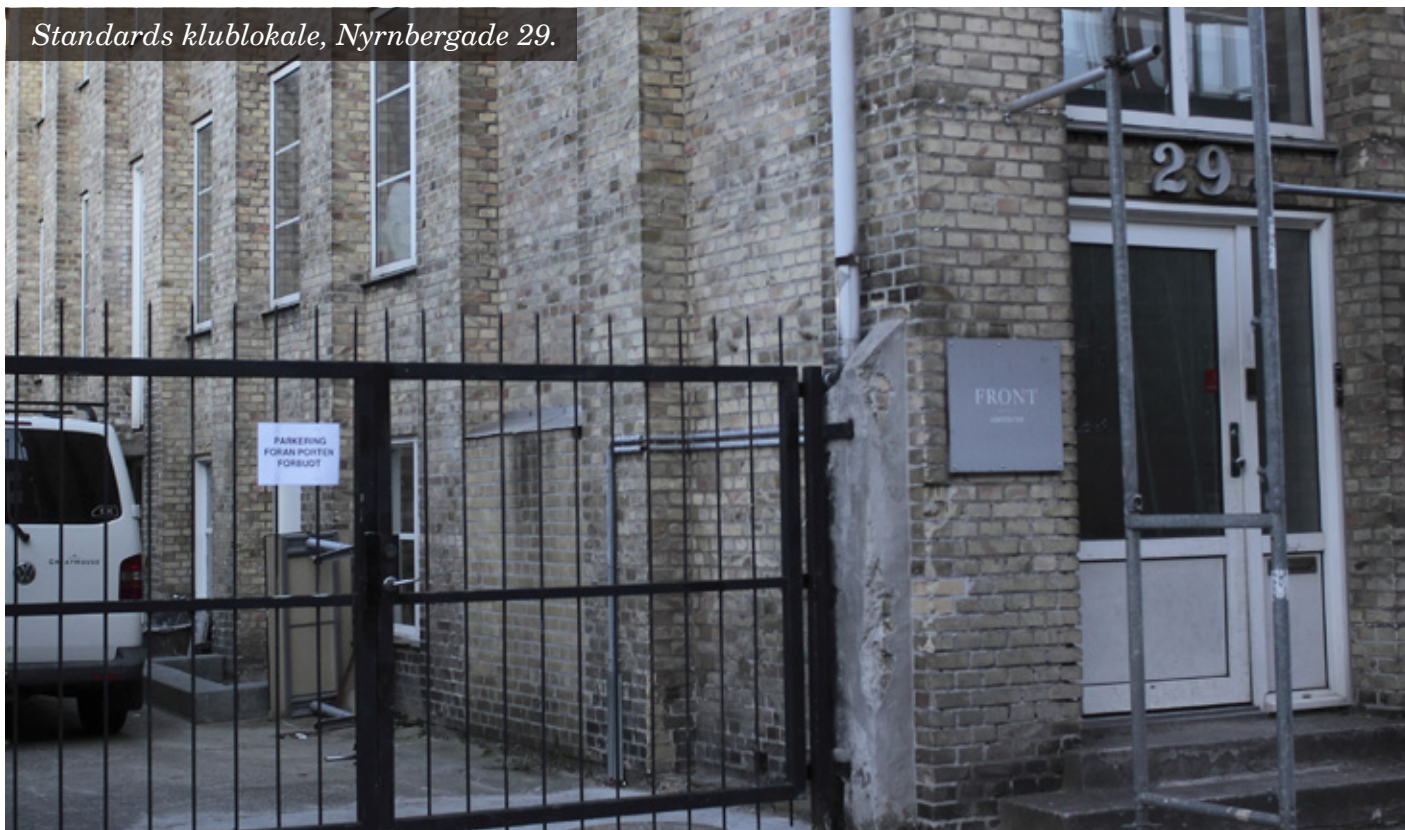
Standards klublokale, Nyrnberggade 29.