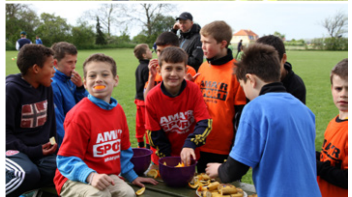
Ungdomslejr i Kappel.