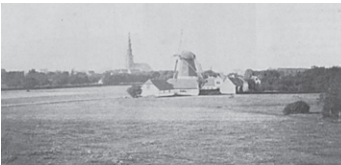
Amagerbro – 1800-tallet.

Boligbyggeriet eksploderer i Københavns S. Fra 1890-1970 (senest Vestamager) bebygges landbrugsarealerne på Amager og folketallet i Københavns S. runder i år 1900 i alt 18.000 mennesker og topper i 1960 med over 115.000 indbyggere og i alt 170.000 på hele Amager.