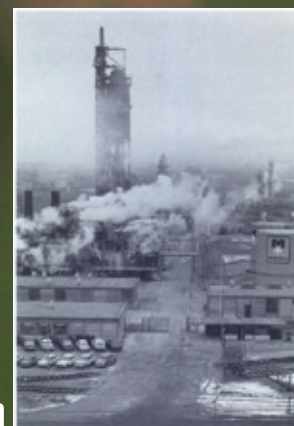
Kampen om Kløvermarken

Statistik – holdfotos – 1. herrer gennem 25 år – og meget mere