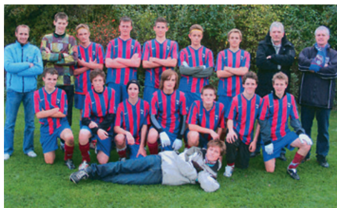
U 16 Årgang 91-92 mange talenter.

2008. En plan for ungdomsafdelingens arrangementer udfærdiges og bekendtgøres- og med hjælp fra aktive forældre gennemføres fastelavnsfest, forårsafslutning, legedagen, familiebingo og juleafslutning. Forældredeltagelsen er flot. KFB opnår 3 rækkevindere U16 (årgang 92-93), U14 (årgang 94-95) og U 13 årgang 96- meget flot.