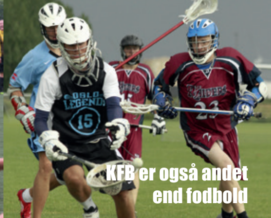
KFB er også andet end fodbold