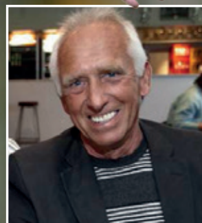
KFBs første cheftræner