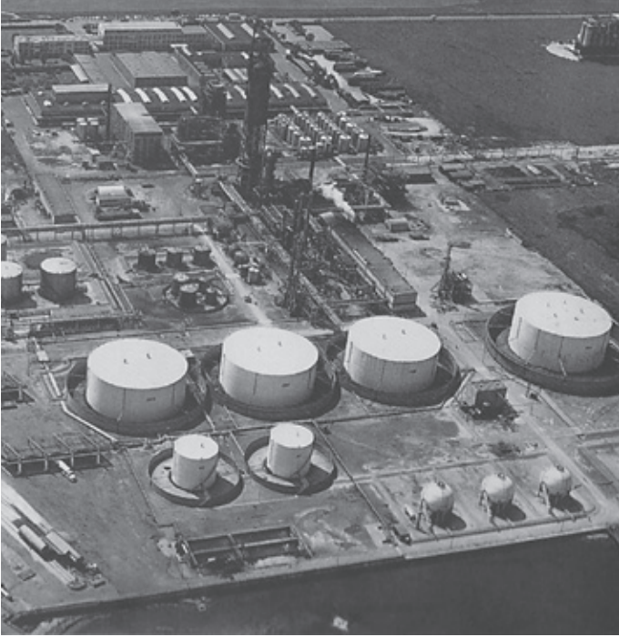
Pyrolyseværket og spritfabrikken.

Vennelyst etableres i 1892 som den første københavnske kolonihave- og 6 andre følger efter på arealet nærmest voldanlægget nord for Kløvermarksvej. Fælledens areal afgrænses hermed mod nord og Kløvermarkens græsarealet reduceres yderligere.