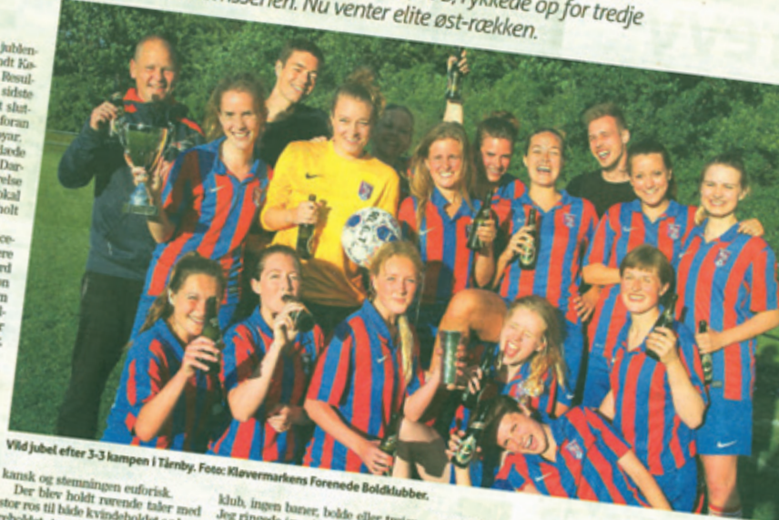
Vildt jubel efter 3-3 kampen i Tårnby.

Såvel kvinde- og herreholdet mødte talstærkt frem og festede igennem i klubhuset, hvor maden var mexi-