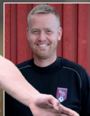
KFBs nuværende cheftræner