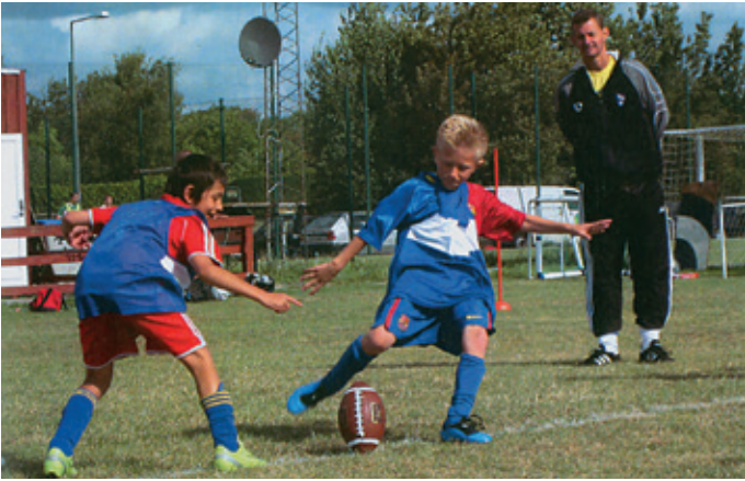
Familiedag i KFB.