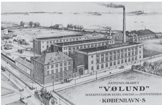
Øresundsvej – i dag boliger og Metro.