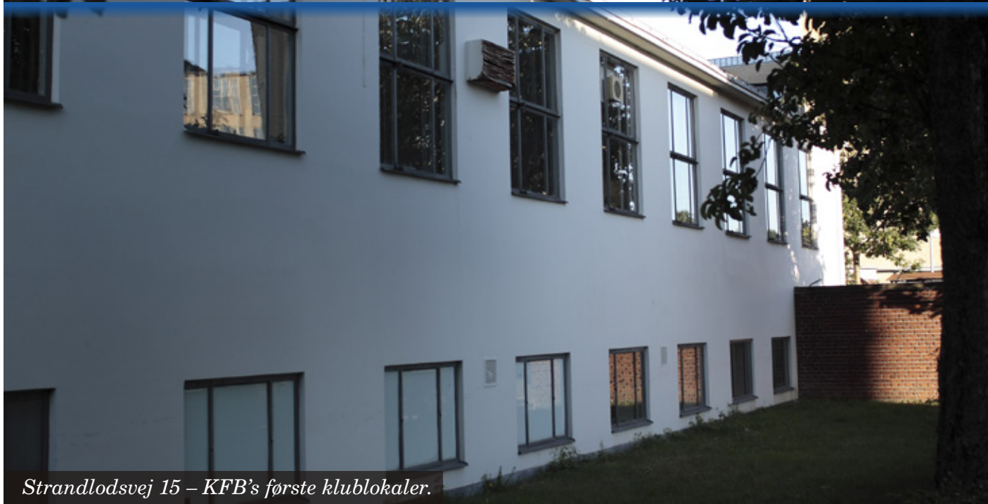
Strandlodsvej 15 – KFB's første klublokaler.

Der er heller ingen tvivl om at dette sociale samvær, med flittig organisering af bl.a. temafester og stor deltagelse af såvel dame- som herrespillerne er med til at gøre fusionen så succesfuld, altså både på og udenfor banen. Forældreforeningens bankospil fortsætter og trækker de mere modne klubmedlemmer over i fusionsklubbens nye lokaler.