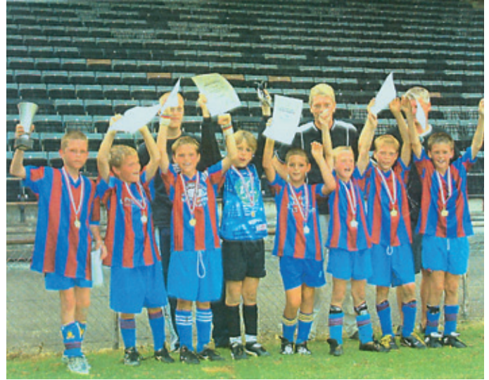
Pokalvinderne 2002 miniputter.