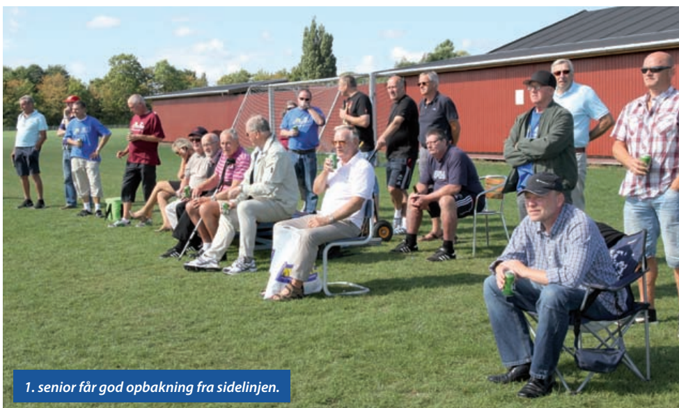
1. senior får god opbakning fra sidelinjen.