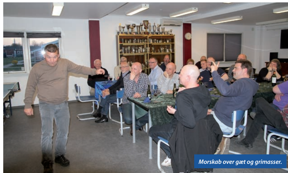
Morskab over gæt og grimasser.