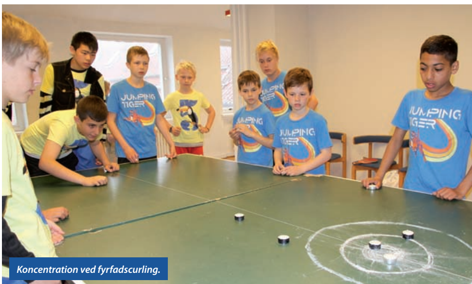
Koncentration ved fyrfadscurling.