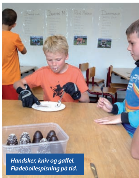
Handsker, kniv og gaffel. Flødebollespisning på tid.

Det var Champions League-finale og stedets forstander havde inviteret hjem til dem (bo-