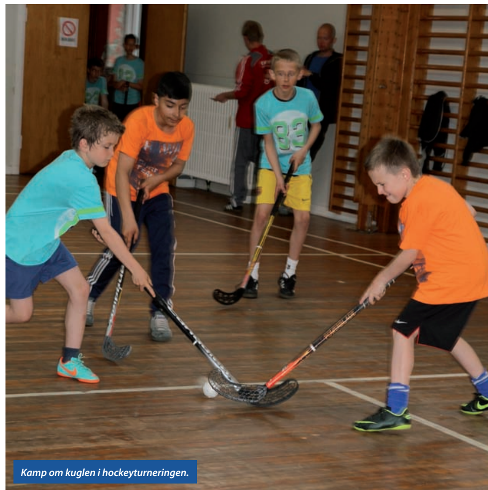
Kamp om kuglen i hockeyturneringen.

Efter frokost, skulle der så uddeles pokaler for den gennemgående turnering. Der blev lagt sammen og trukket fra, og så kom det endelige resultat: