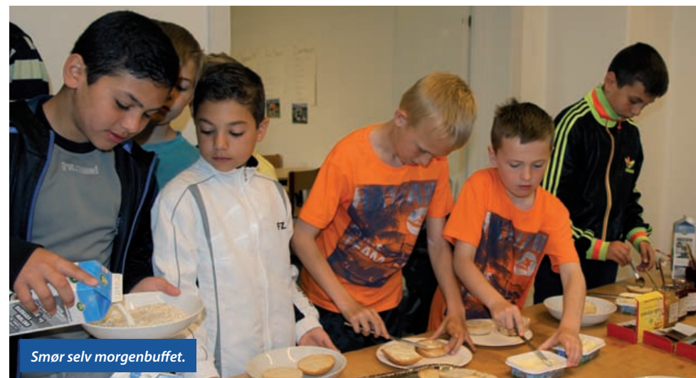
Smør selv morgenbuffet.

Der var forskellige dagspræmier til enkelte drenge, så derfor var det også vigtigt at præstere, hjælpe hinanden, eller for eksempel udføre noget fantastisk, da man så kunne blive valgt som modtager af en sådan præmie.