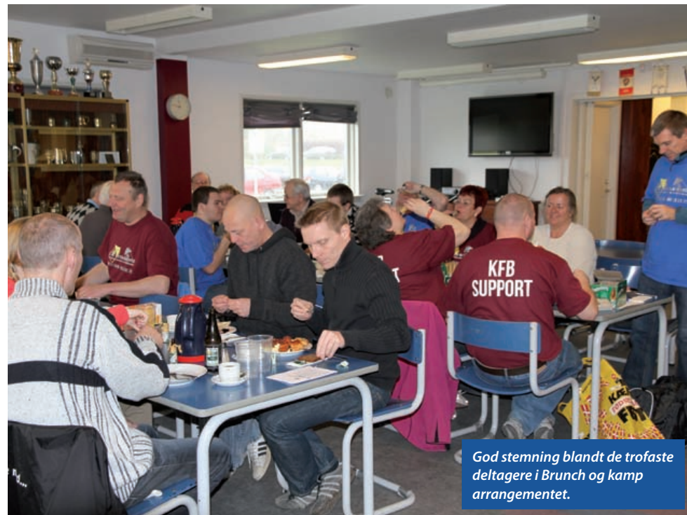
God stemning blandt de trofaste deltagere i Brunch og kamp arrangementet.