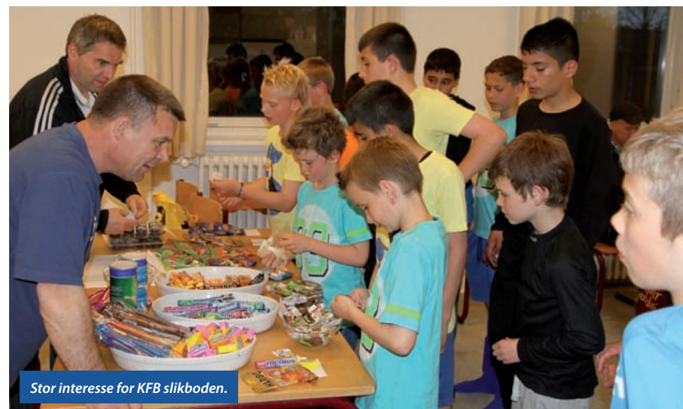
Stor interesse for KFB slikboden.