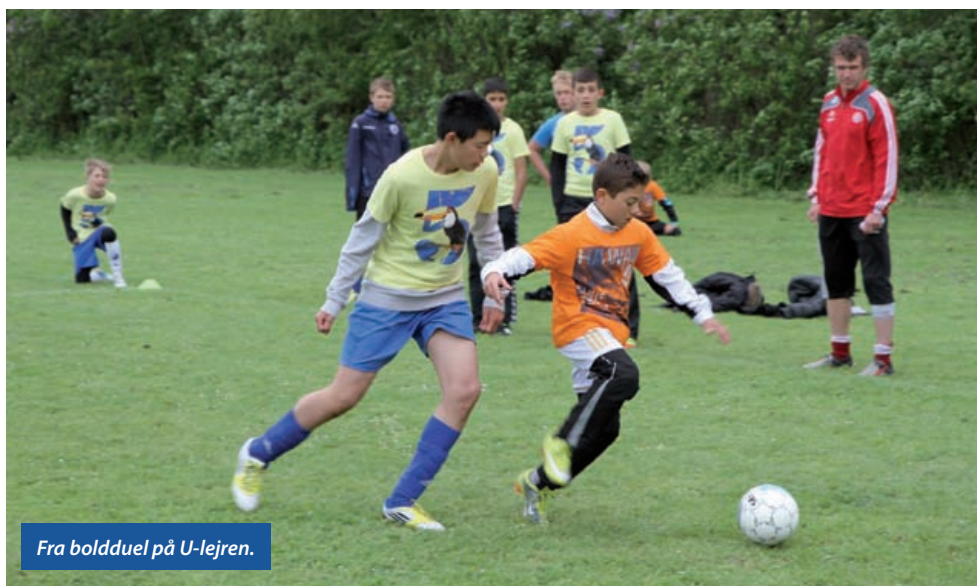
Fra boldduel på U-lejren.