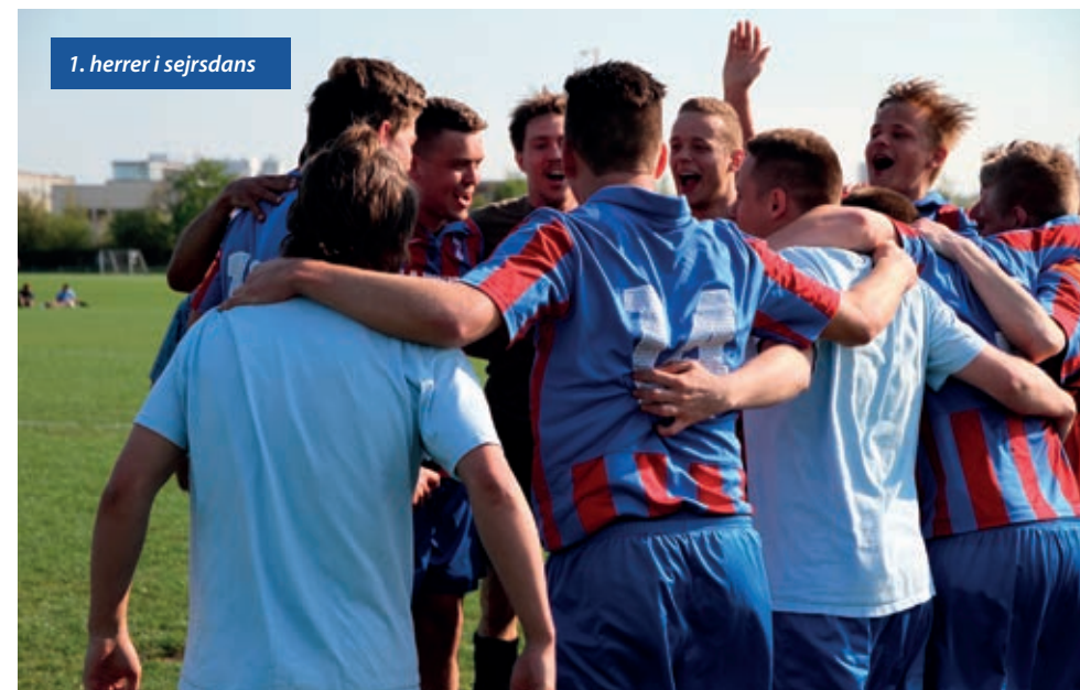
1. herrer i sejrscens