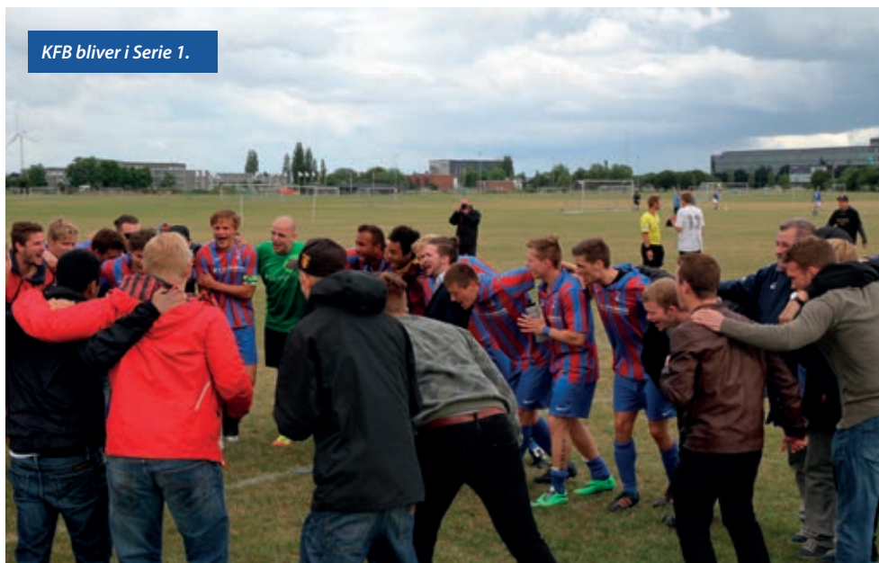
KFB bliver i Serie 1.