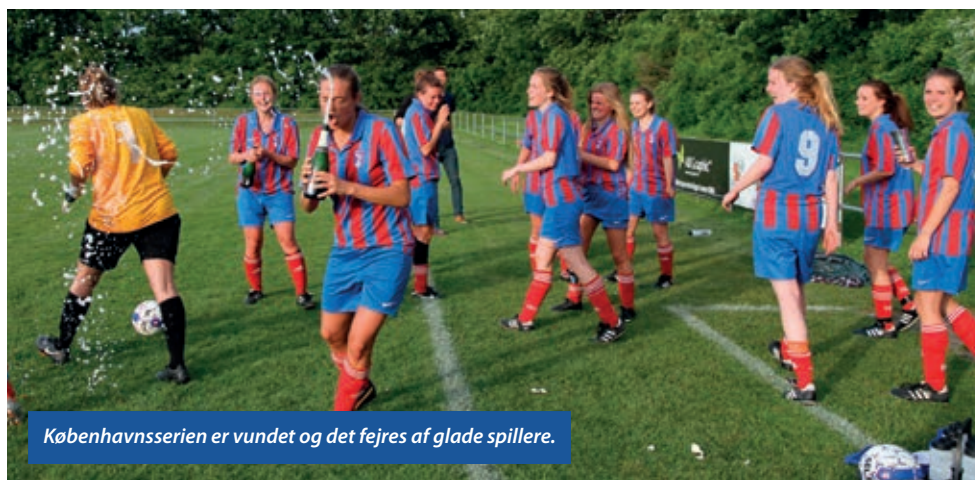
Københavnsserien er vundet og det fejres af glade spillere.