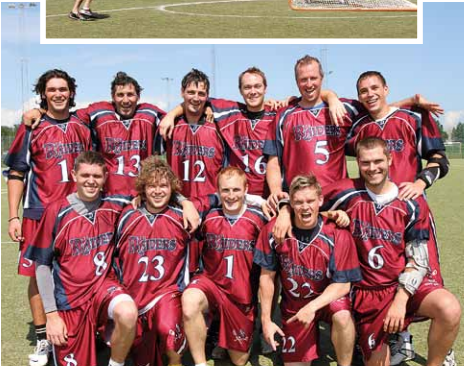
Danmarks førende hold og 3 gange mester KFB Lax