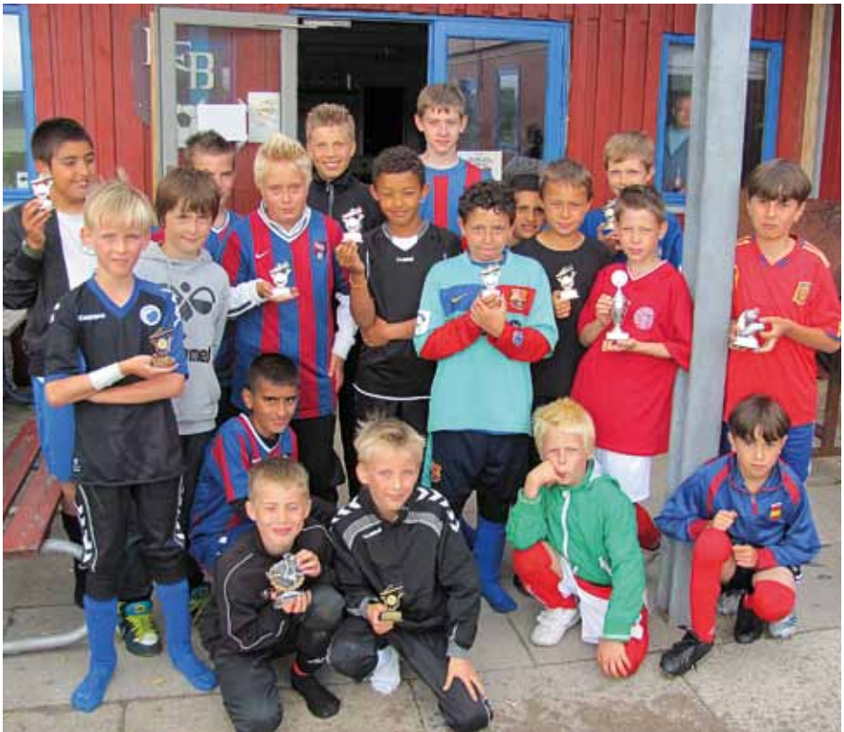
Glade deltagere ved ungdommens afslutning

Skal det være lørdag i stedet for søndag?