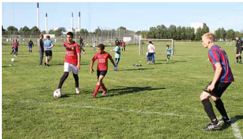
Ungdommen igang med øvelserne

Det blev en inspirerende dag med rigtig mange af vores ungdomsspillere igang sammen. Træningsmæssigt var der fine øvelser at tage med videre, men socialt var dagen givtig for vores klub. Det var dejligt at se glæden ved at mødes på tværs af alderstrin, et tiltag som taler for en gentagelse.